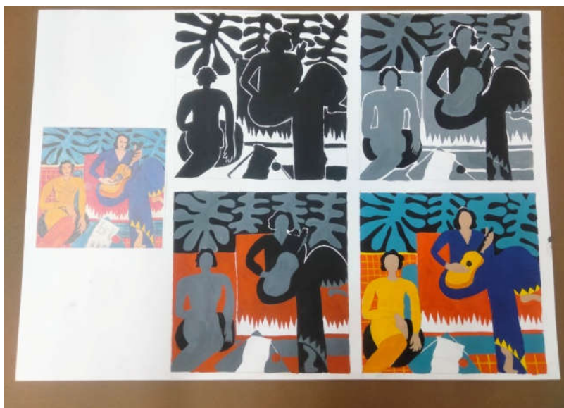
София Д. (14 лет) Анализ репродукции Анри Матисса "Музыка"