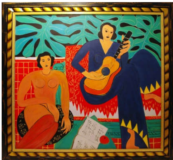
Анри Матисс "Музыка"