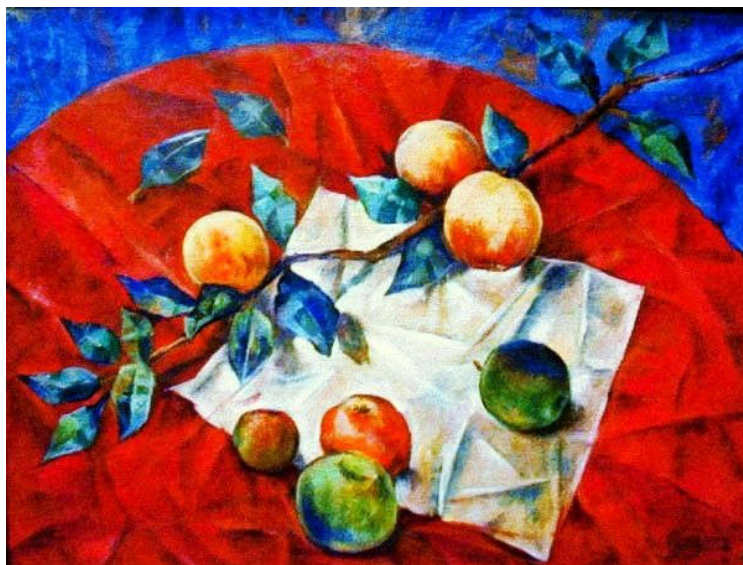
К. Петров-Водкин "Ветка яблони"